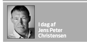
I dag af Jens Peter Christensen

I virkelighedens verden fungerer det ikke altid helt så godt. Men selve princippet om, at magten legitimeres af folket, at magthaverne kun er magthavere, så længe folket vil, at magten er bundet af loven,